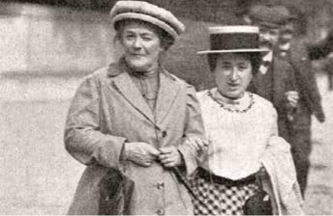
Clara ZETKİN (solda), Rosa LUXEMBURG

8 Mart 1857 tarihinde ABD'nin New York kentinde 40.000 dokuma çalışanı daha iyi çalışma koşulları için bir tekstil fabrikasında grev yaparken çıkan yangın sonucunda 129 kadın çalışan hayatını kaybetti ve 1910 yılında, Clara Zetkin'in girişimleriyle bugünün Dünya Kadınlar Günü olarak anılmasına karar verildi. Alınan bu kararla birlikte, her yıl 8 Mart'ta kadınların ne kadar değerli olduklarını ortaya koyacak kutlamalar başladı.