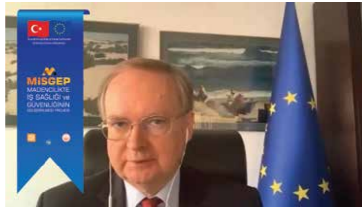
Büyükelçi Christian BERGER- AB Türkiye Delegasyonu Başkanı

Açılış oturumunun bir diğer konuşmacısı da AB Türkiye Delegasyonu Başkanı, Büyükelçi Christian BERGER'di. BERGER izleyicilere Avrupa Birliği Türkiye Delegasyonu olarak iş sağlığı ve güvenliği alanında işverenlerin sürece daha fazla dahil edilerek madencilik sektörünün kapasitesinin geliştirmeyi hedefleyen bu projeyi çok önemstediklerini vurguladı. İş sağlığı ve güvenliğinin çalışma hayatındaki önemini altını çizen BERGER, projenin tüm taraflara önemli katkılar sunmasını temenni ettiklerini belirtti.