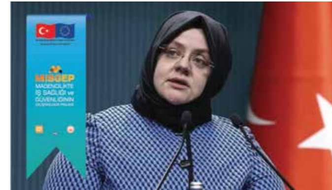
Zehra Zümrüt SELÇUK - Aile, Çalışma ve Sosyal Hizmetler Bakanı

sorun olan iş kazalarını ülkemizde en asgari düzeye indirebilmek. Tek bir çalışmamızın dahi mesleği sebebiyle hayatını kaybetmediği, sağlıklı ve güvenli bir çalışma hayatına kavuşabilmek" dedi. MİSGEP projesiyle çalışmalarının daha etkin ve kalıcı hale gelmesini hedeflediklerini vurgulayan SELÇUK, yer altı maden işletmelerine iş sağlığı ve güvenliği alanında yaklaşık 66 milyon lira destek sağlanacağını müjdesini verdi.